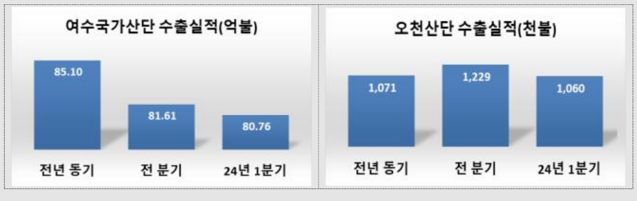
<여수국가산단 분기별 수출실적>